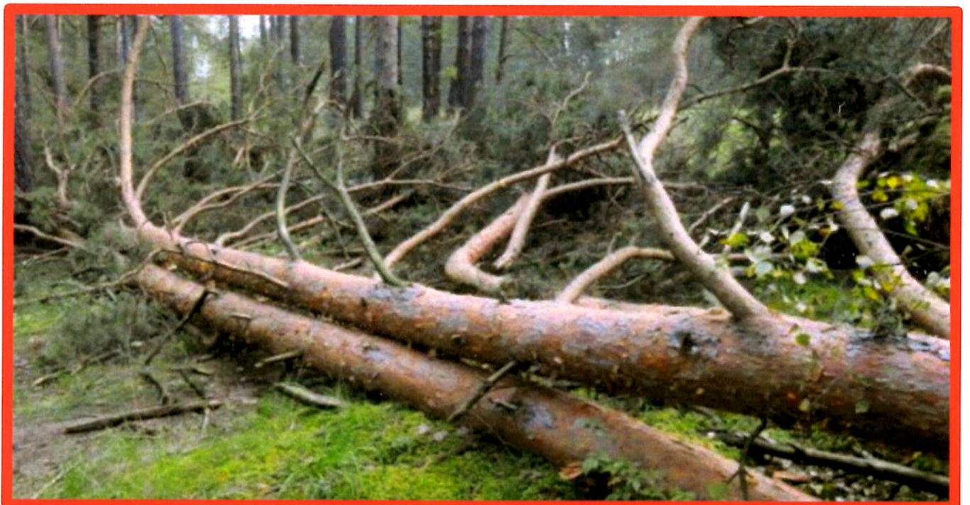
Лежащее на поверхности земли ветровалное дерево, не имеющее признаков отмирания. Не является валежником

Кроме того, необходимо обратить внимание, что деревья, которые лежат на земле, но не имеют признаков естественного отмирания (имеют зеленую листву или хвою), определять как «мертвые» не допускается (смотри изображение № 5).