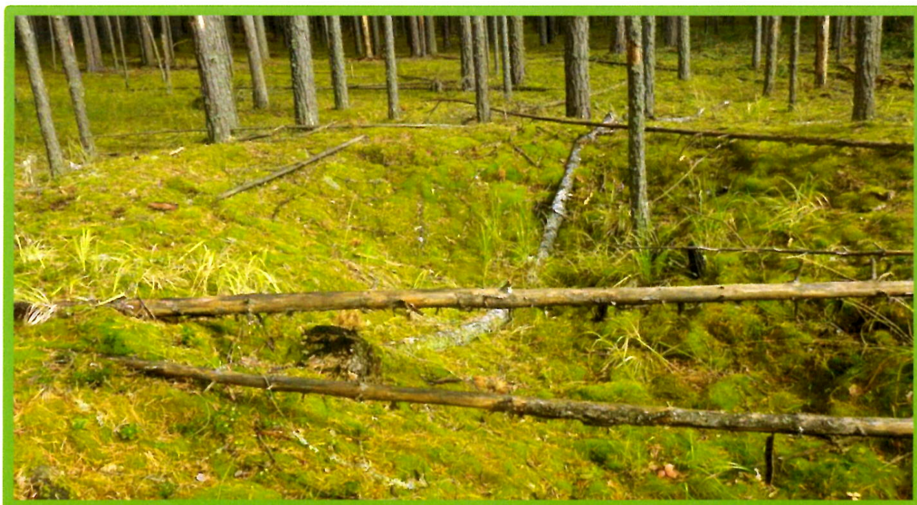
Изображение № 1 Валежник

Примеры валежника (смотри изображения №№ 1,2,3).