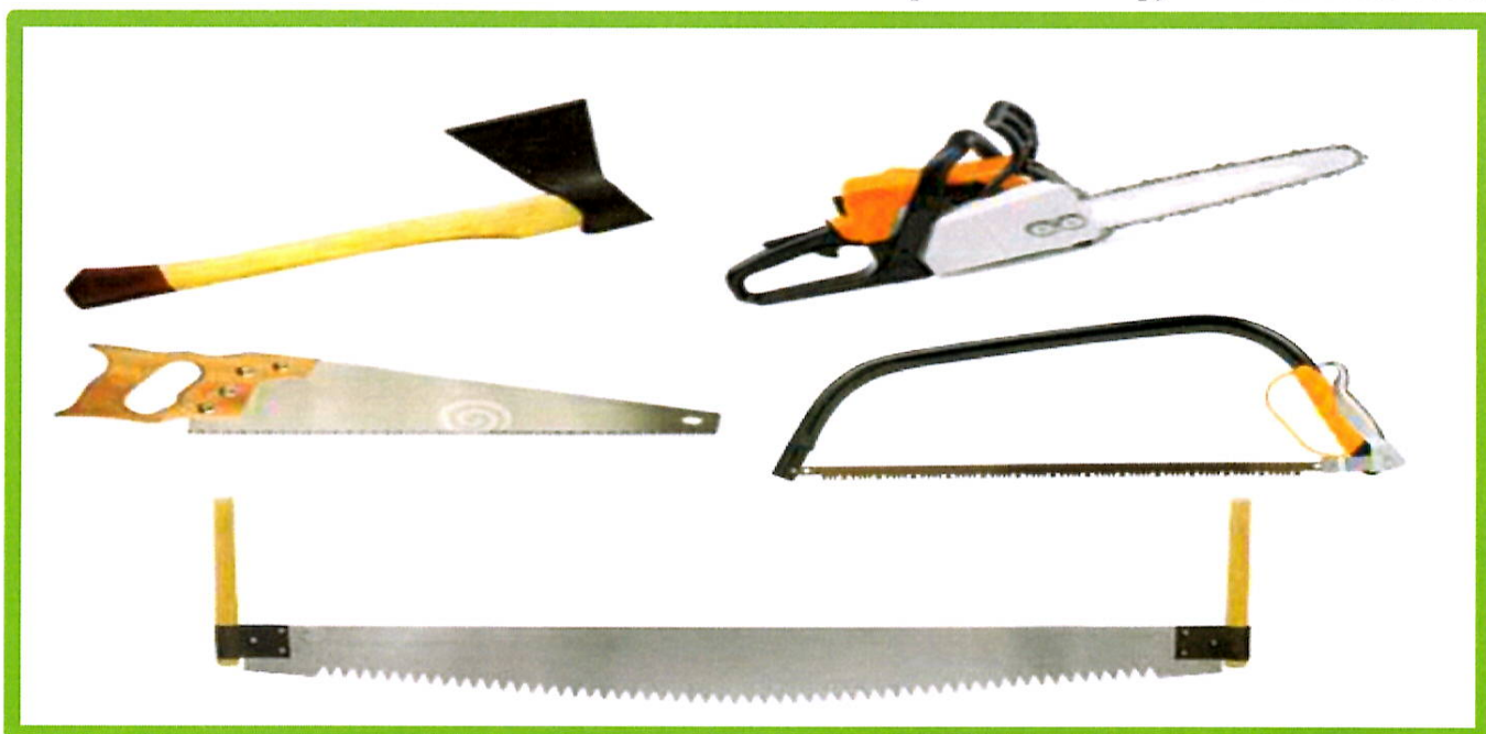
Изображение № 8 Разрешенные инструменты для заготовки

При заготовке валежника допускается применение ручного инструмента (ручных пил, топоров, бензопил) ( смотри изображение 8 ).